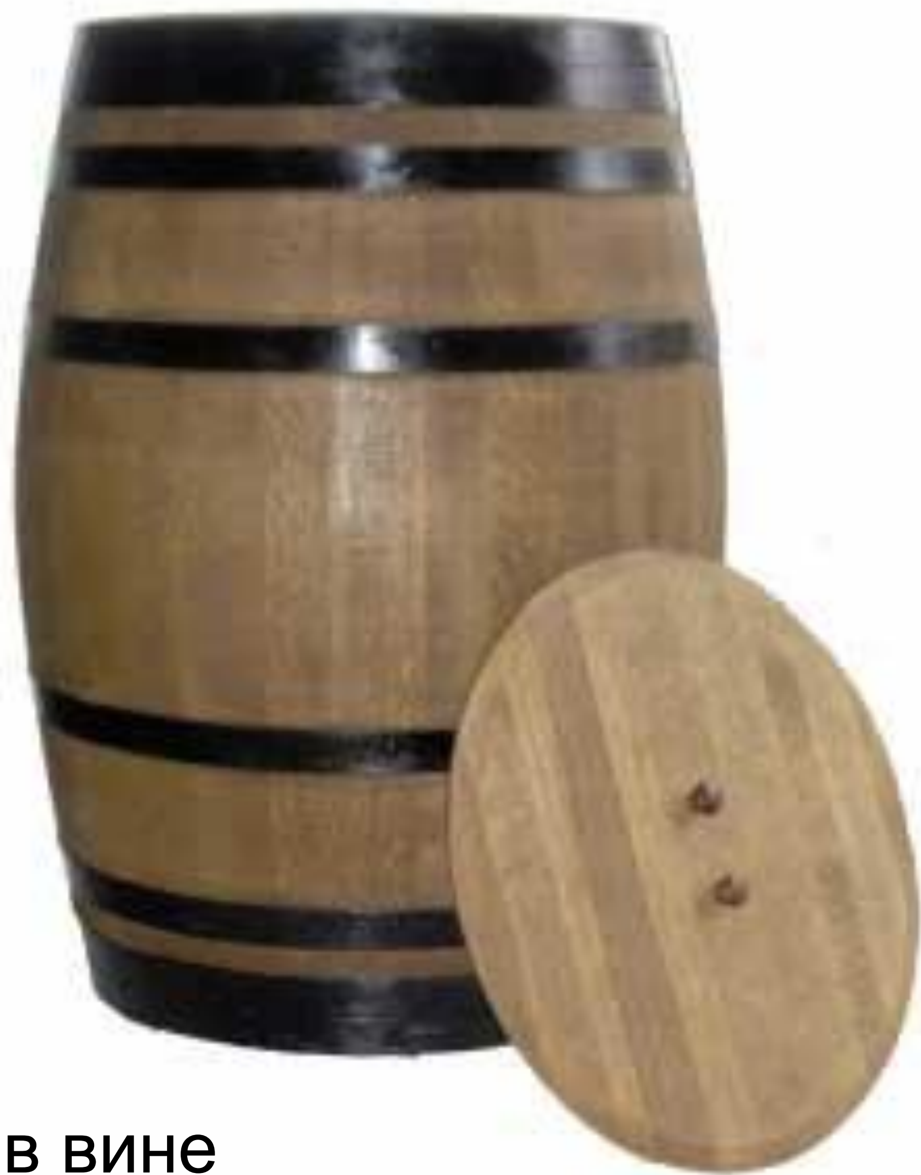
чай в вине