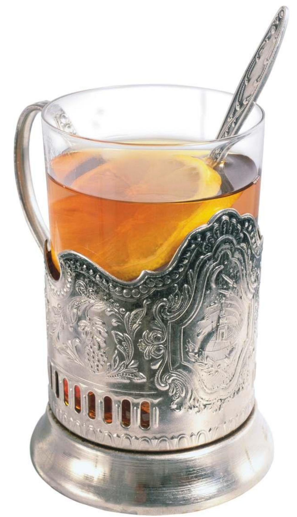
вина в чае